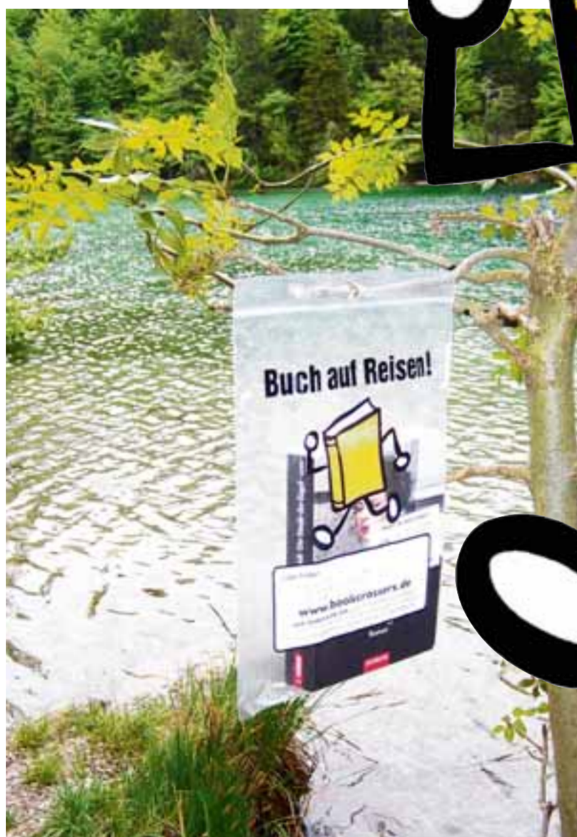
Da hängt ein Buch an 'nem Baum (hier am Altmühlsee in Füssen): Wer bei einem solchen Anblick an seinem Verstand zweifelt, tut sich selbst Unrecht. Er ist höchstwahrscheinlich auf eine Hinterlassenschaft der „Bookcrossing“-Bewegung gestoßen.

➤ Internetseiten: www.bookcrossing.com Die Seite ist auf Englisch. Hilfe und Informationen auf Deutsch: www.bookcrossers.de